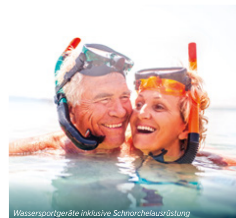
Wassersportgeräte inklusive Schnorchelausrüstung